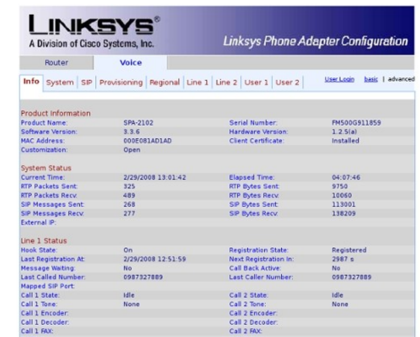
Imagen 1-2: Interfaz web Linksys